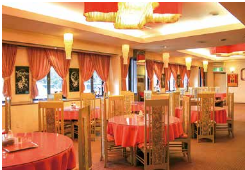
ホテルプラトン1階 レストラン『かわいい食堂』

お食事はホテルプラトンの レストランでお召し上がり いただけます。 夕食/17:00~20:30(LO.20:00) 朝食/6:00~9:00